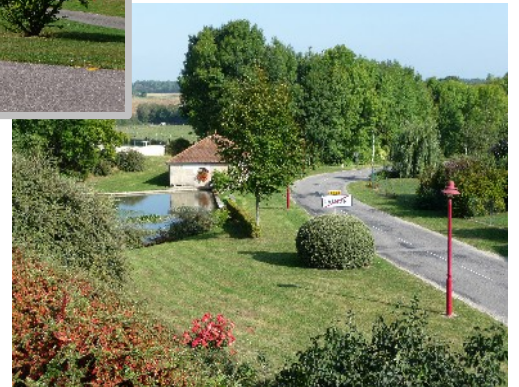
Fleurissement du village