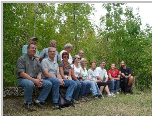
Journées du patrimoine