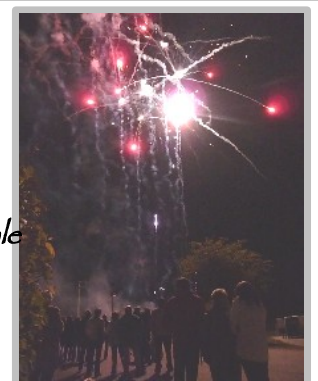
Fête patronale feu d'artifice