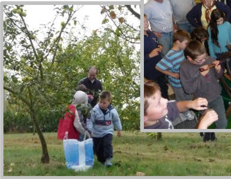
Fête de la pomme