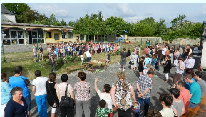
La kermesse scolaire de fin d'année

Nous pensons à tous nos étudiants, ceux qui ont été malmenés par le stress des examens, et à nos chers écoliers qui vont pouvoir profiter de cette longue récréation.